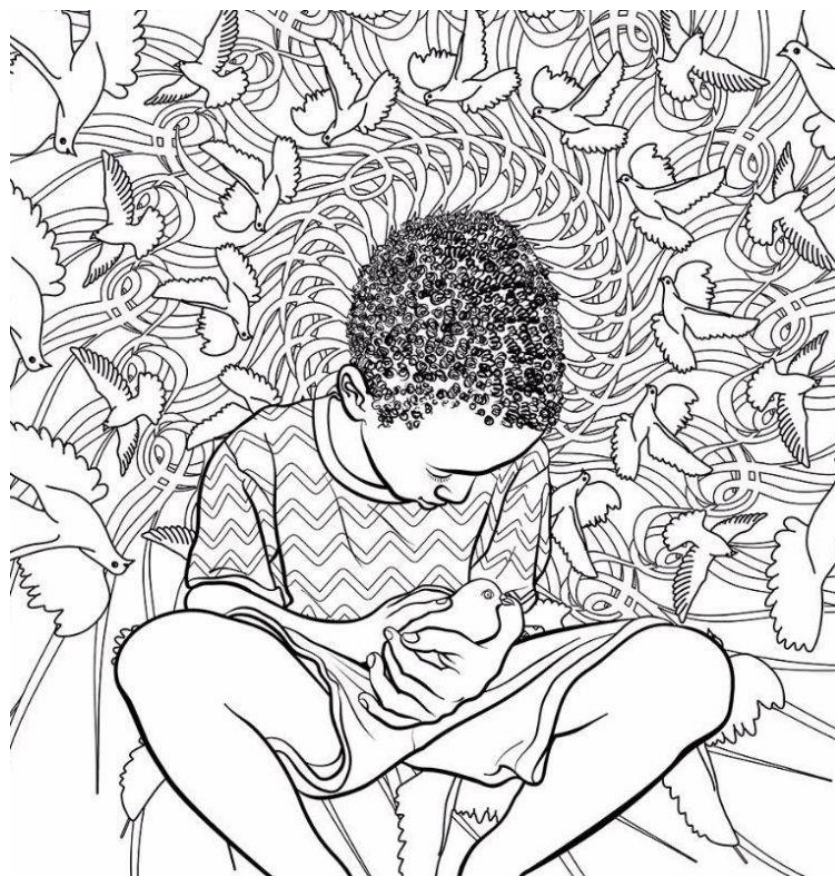
איור: אמיתי סנדי, מתוך הספר

ספרי ילדים, מרגע שמתחילים לקרוא בהם, מופעלת באמצעותם הקשבה נדירה לקולם של אחרים: הישיבה יחד, ההאזנה הקשובה לקולה של אמא ולקולן של הדמויות בתוך הסיפור שיוצאים מפיה, ההשתקעות באיורים, ההתמסרות לנקודת מבטו של המאייר, קצב הדפדוף שקשוב לקצב קריאתם של כל הקוראים, מבוגרים וילדים, ההזדהות הרגשית עם הדמות, הסקרנות כלפי עולמה — כל אלה מתרגלים הכרה באחר ומוכיחים, גם לבני השנתיים-שלוש, כמה משתלם להקשיב לקולם של אחרים.