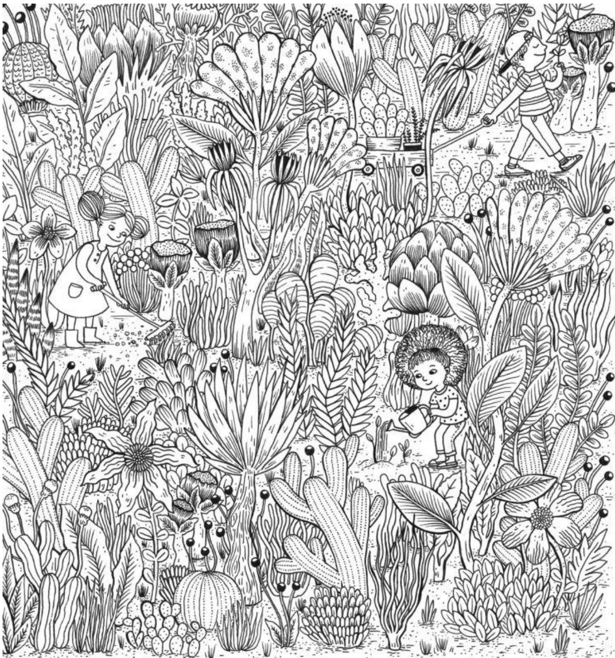
איור: גפן רפאלי, מתוך הספר

תחילה לעולם הממשי: הספר נועד להסב את תשומת הלב לילדים שקופים במיוחד בחברה הישראלית, ילדי משפחות מבקשי המקלט. הוא מבקש להנכיח אותם בין דפי הספר כ"אני" דובר, ולפנות אליהם גם כקוראים פוטנציאליים.